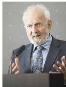
Ernst Ulrich von Weizsäcker

Dass solche Auslandseinsätze in Zukunft zunehmen, befürchte ich angesichts des wachsenden deutschen Rüstungshaushalts und der Programme fast aller Parteien. Lieber sähe ich, dass die Bundesregierung auf Gerechtigkeit setzt, teilt und sich so Freundschaften mit anderen Ländern bilden. Ausgaben für die Armen schaffen (menschliche) Sicherheit.