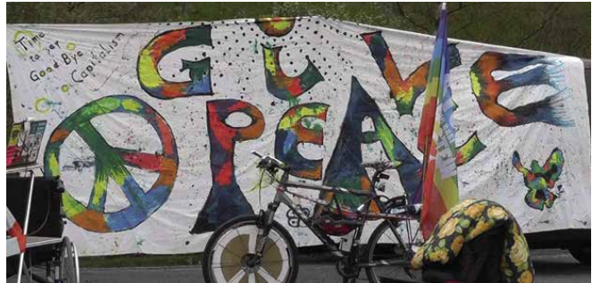
Fahrradmarathon Stopp Air Base Ramstein 30.04.2021

Angeichts der aktuellen Herausforderungen, vor denen wir stehen, handelt es sich hier um eine aberwitzige Verschwendung von öffentlichen Mitteln, die wir dringend für andere Zwecke benötigen. Im Zuge der Corona-Krise haben sich die sozialen Ungleichheiten und die Verteilungskonflikte in unserem Land verschärft. Gleichzeitig leben wir, getrieben durch den Klimawandel und durch rasante Fortschritte bei der Entwicklung und dem Einsatz digitaler Technologien, in einer Zeit gewaltiger Umbrüche. Eine sozial gerechte, ökologisch nachhaltige und wirtschaftliche vernünftige Gestaltung der damit verbundenen